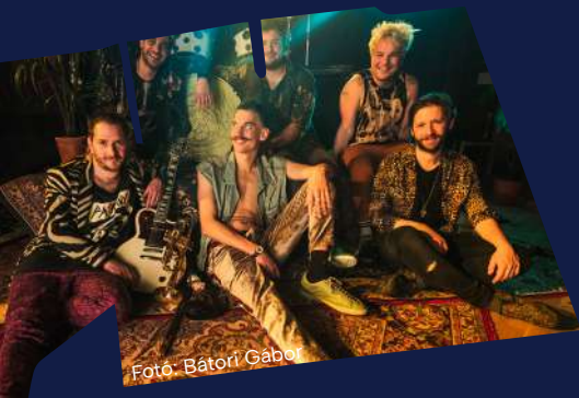
Fotó: Bátori Gábor